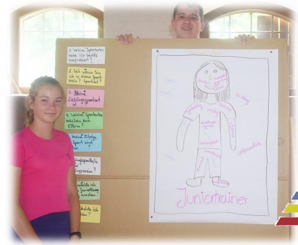
- Impressionen 2020 -